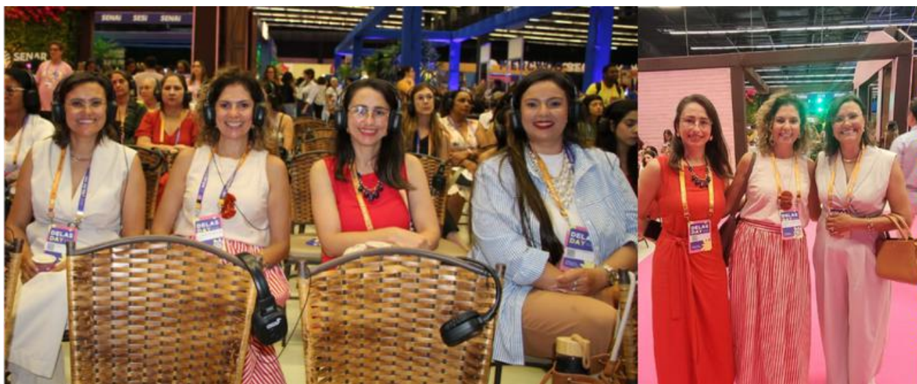
Servidoras UEMS participando do Delas Day edição 2026

Considerado o maior evento do estado de Mato Grosso do Sul voltado ao empreendedorismo feminino, o Delas Day – edição 2026 foi realizado nos dias 24 e 25 de fevereiro, em Campo Grande, reunindo instituições, universidades e iniciativas voltadas à inovação e ao desenvolvimento social. A Universidade Estadual de Mato Grosso do Sul (UEMS) participou da programação, promovida pelo SEBRAE/MS com apoio de diversas instituições.