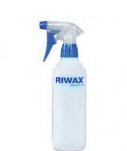
MINI SPRAYER 500 ML