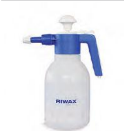
SPRAY-MATIC 1,25 L