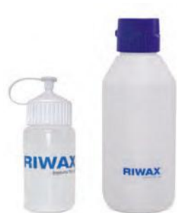
MŰANYAG FLAKON 250 / 500 ML