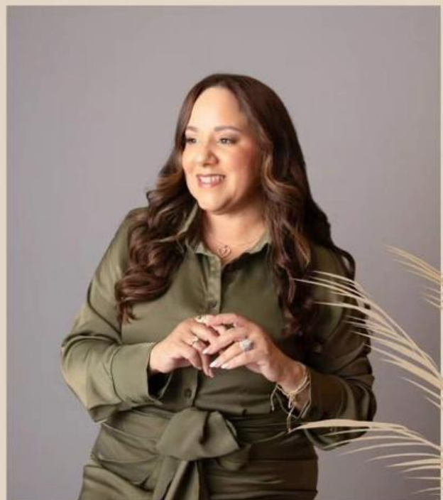
Lider y fundadora del ministerio Nosotras