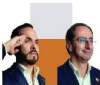
ABELARDO DE LA ESPRIELLA Presidencia JOSÉ MANUEL RESTREPO ABONDANO Vicepresidencia

El respaldo obtenido por Abelardo de la Espriella refleja el crecimiento de un sector de la población que reclama medidas más firmes frente a la delincuencia, el fortalecimiento de la autoridad y una recuperación de la confianza en las instituciones.